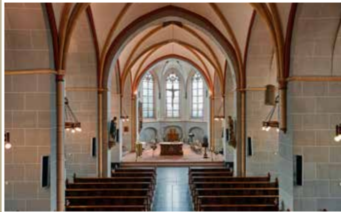
Historische Vereniging Zutphen

Bergh geheime onderhandelingen met de Prins van Parma. Ondanks dat Van den Bergh later tóch stadhouder werd, bleef hij contact houden met Van Parma. Toen dit bekend werd, werd Van den Bergh met zijn vrouw vastgezet, maar vanwege te weinig bewijs toch weer vrijgelaten. Daarna koos hij definitief en openlijk voor de Spaanse kant.